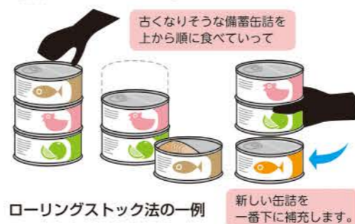
ローリングストック法の一例 古くなりそうな備蓄缶詰を上から順に食べていって 新しい缶詰を一番下に補充します。

日常生活で使用する食材やレトルト食品を、備蓄品の中から消費し、その都度買い足す事で備蓄品を新しい状態で保つ事をローリングストック法といいます。日常的に防災用品をチェックする事もできます。